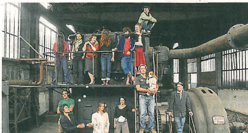
Le fabuleux des Galapiats à travers l'Argentine et le Chili.

Sur le Chemin de la route, témoin de l'intérieur, de ce à quoi