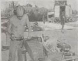
Des ateliers à ciel ouvert ont été installés afin de fabriquer les décors.