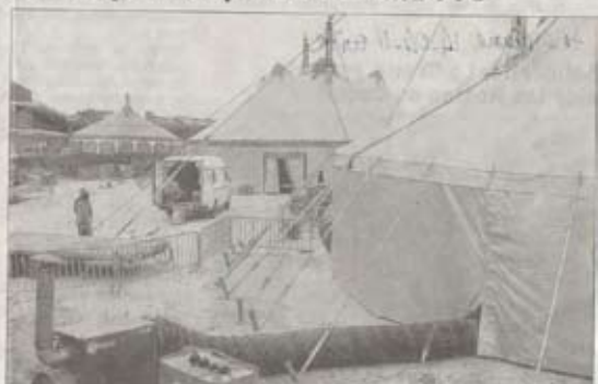
Trois chapiteaux ont été montés dans le parc du Grand Pré. L'un pouvant accueillir 400 spectateurs, le second, 200, le dernier étant affecté à la restauration du public et des artistes.

Accueillir un festival de cirque, cela ne s'improvise pas. Depuis une semaine, organisateurs et bénévoles s'activent pour monter les chapiteaux dans le parc du Grand Pré.