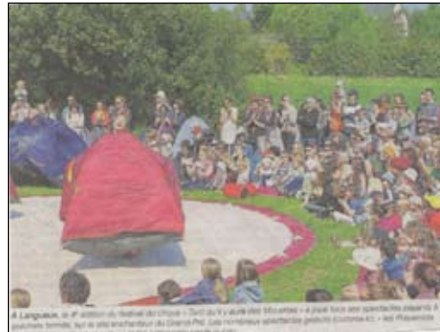
À Languieux, le 4 e édition du festival du Cirque « Tant qu'il y aura des mouettes » a joué tous ses spectacles depuis le dimanche matin, sur le site archaïque du Grand-Pré. Les nombreux spectateurs peinent à trouver un emplacement pour s'asseoir.