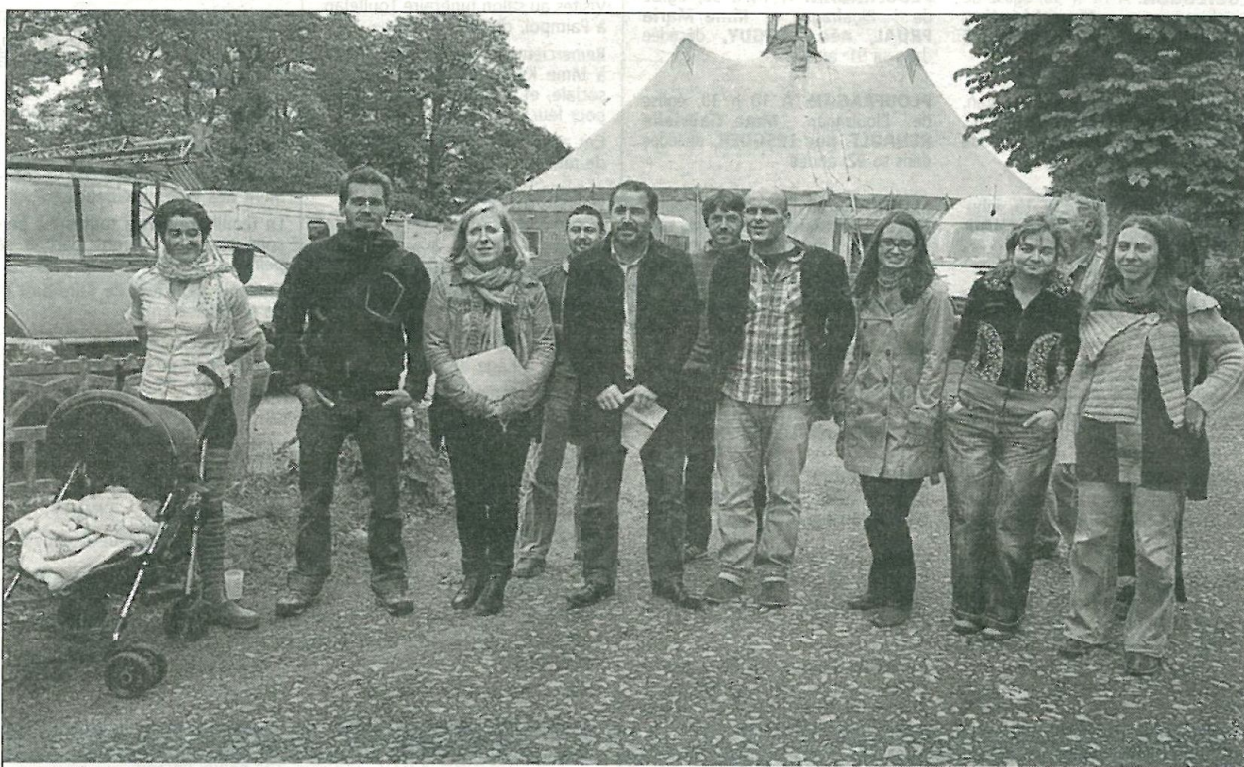
Les différents partenaires de l'opération ont fait le tour des infrastructures mises en place à Bon Sauveur, mardi.