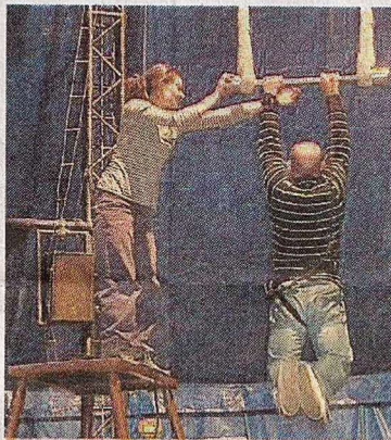
Durant six semaines, les artistes ont vécu et travaillé avec les patients.