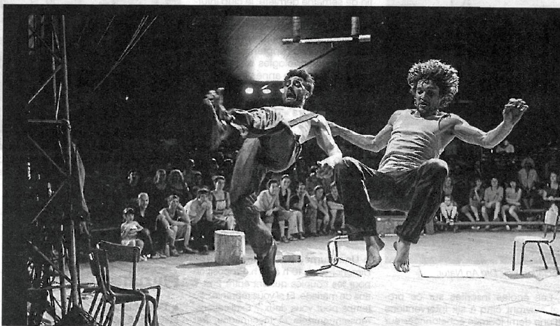
Sous le chapiteau érigé dans le parc de la Fondation Bon-Sauveur, les artistes de Galapiat invitent le public à deux séances publiques de Risque ZérO .