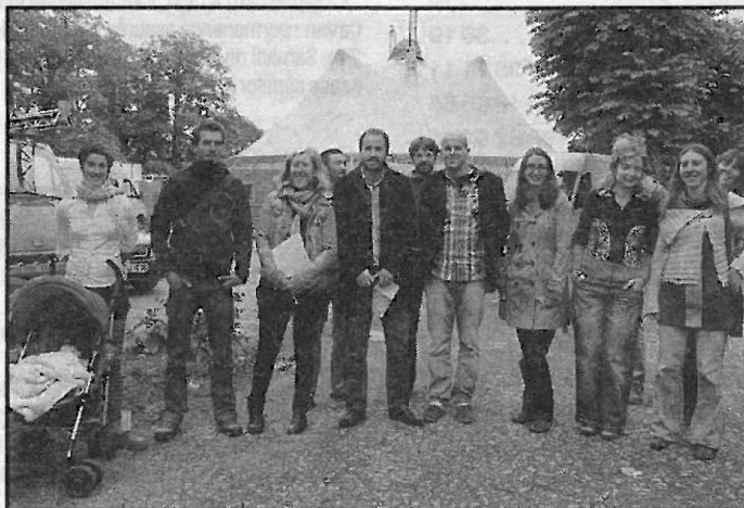
■ Les représentants de Galapiat, de la fondation Bon Sauveur, du Carré Magique et autres structures qui participent à l'événement.

Jusqu'au 17 novembre, la fondation Bon Sauveur accueille la compagnie artistique Galapiat et ses chapiteaux. Spectacles, rencontres et ateliers sont programmés. Pour les artistes, cette résidence est aussi un temps de réflexion pour mener à bien leurs nouveaux projets.