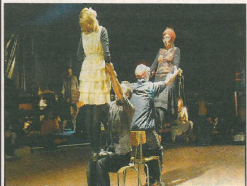
Après neuf jours d'atelier seulement, les personnes accueillies et le personnel de Bon Sauveur ont offert un spectacle de qualité sous un des chapiteaux implantés à l'hôpital.