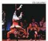
Destreza Los artistas presentan disciplinas clásicas circenses.

Compañía de circo Galapiat "Riesgo Cero" Teatro Duoc UC, Edificio Cousiño Hoy a las 21.30 horas