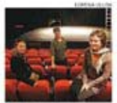
Nueva promesa La compañía ha recibido elogios de la crítica.

"Es interesante compartir la visión de cómo se hace circo acá y cómo se puede hacer, dentro del contexto político, social y cultural. Lo que vemos acá es que hay un momento en donde se están abriendo espacios, hay un reconocimiento a la labor que se ha realizado, pero falta que los artistas chilenos se den cuenta de que hacen circo interesante y que tienen que seguir en la misma senda y valorar la cultura local", así